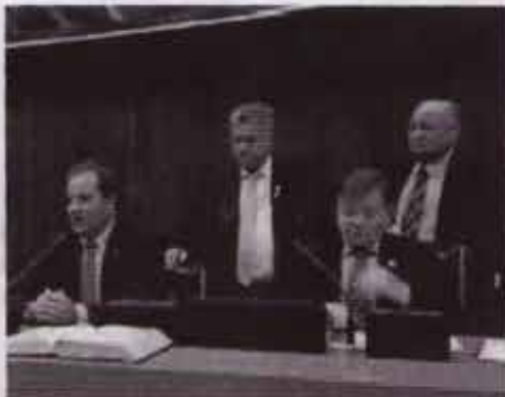
Gli ingegneri dell'Aquila al Parlamento del Paraíba (Brasile)

«Un incontro di elevato profilo istituzionale che conferma l'autorevolezza raggiunta dai rappresentanti della cate-