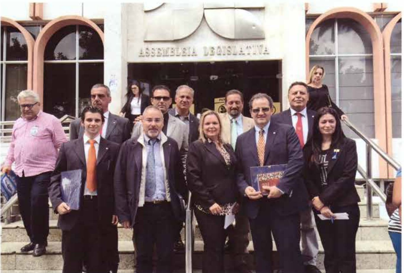
Ingresso dell'Assemblea Legislativa dello Stato del Paraibe