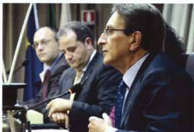
Il Sindaco dell'Aquila Massimo Cialente durante il saluto ai giovani professionisti