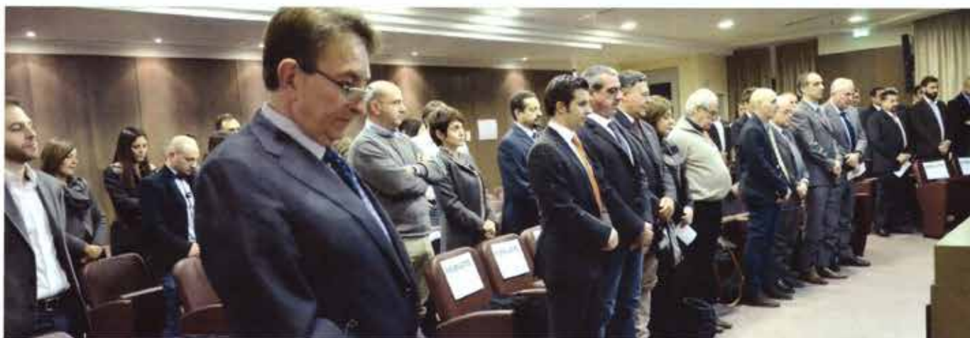
Minuto di raccoglimento in memoria delle vittime di Parigi