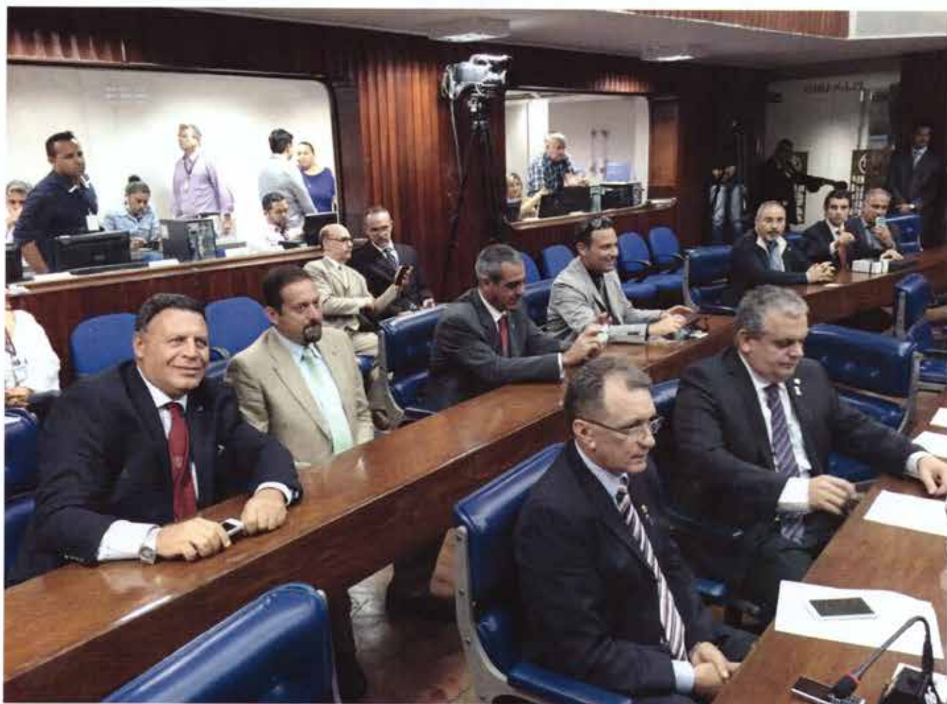
Aula del Parlamento dello Stato del Paraibe durante l'incontro con la rappresentanza degli Ingegneri Italiani