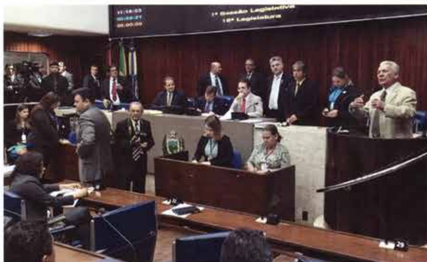
Il Presidente Masciovecchio insieme ai vertici del Parlamento dello Stato del Paraibe ascolta l'intervento del deputato Jose' Aldemir che introduce il gruppo di professionisti all'Assemblea plenaria

Dopo l'intesa con i colleghi sudamericani la delegazione guidata dal Presidente Masciovecchio è stata ricevuta all'Assemblea Plenaria per un incontro di elevato profilo istituzionale. Quindi il confronto sul restauro dei beni storici con la Soprintendenza locale