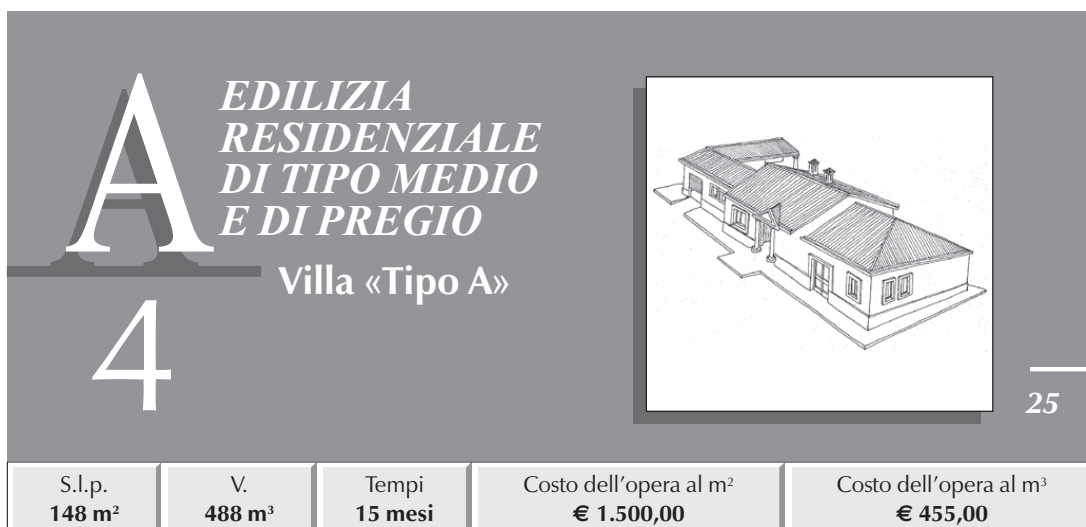
TABELLA RIASSUNTIVA DEI COSTI E PERCENTUALI D'INCIDENZA