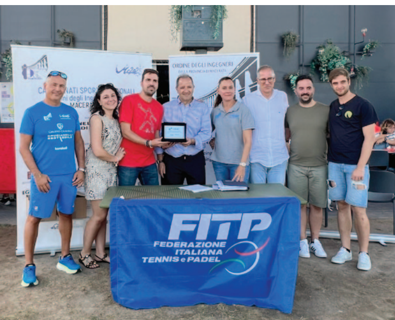
Premiazione gruppo Padel – Macerata 2025

La Polisportiva resta aperta ad accogliere adesioni e collaborazioni da parte di tutti i colleghi che volessero partecipare al fine di promuovere una sempre maggiore coesione, condivisione e socializzazione attraverso lo sport.