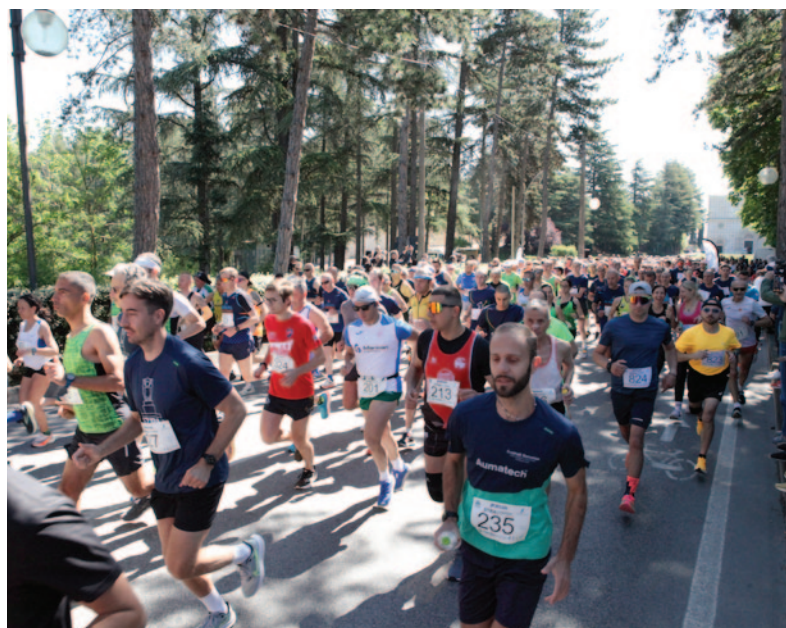
Stracittadina Città dell'Aquila 2025 – partenza

In occasione della Stracittadina Città dell'Aquila 2025,