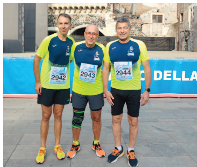
Campionato Ingegneri Catania 2023

Recentemente si è formato il gruppo padel che si è subito distinto in occasione ai Campionati per Ingegneri, in occasione dell'ultimo Congresso Nazionale tenutosi a Macerata.