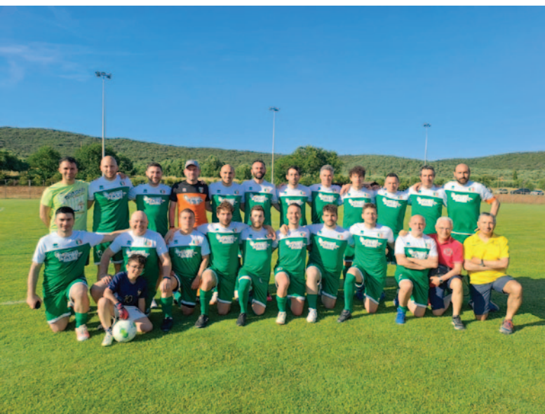
Formazione Macerata 2025